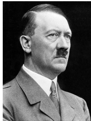
Adolf Hitler 1889 – 1945 Allemagne