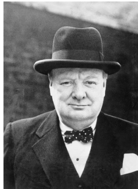
Winston Churchill 1874 - 1965 Royaume-Uni