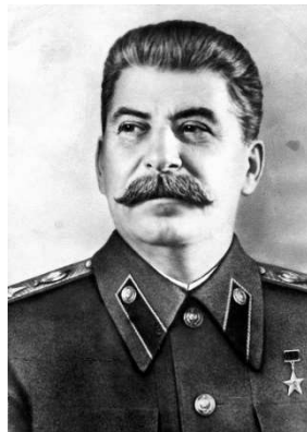
Joseph Staline 1878 – 1953 URSS