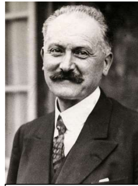
Albert Lebrun 1871 - 1950 Président de la République Française de mai 1932 à juillet 1940.