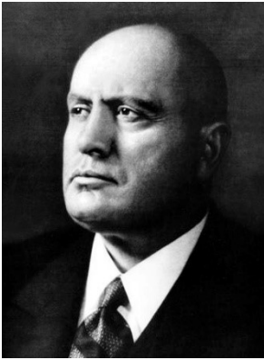
Benito Mussolini 1883 – 1945 Italie