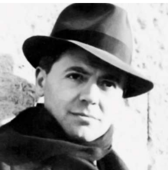
Jean Moulin 1899 - 1943 Fonctionnaire français Grand résistant