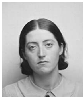
Lucie Aubrac 1912 - 2007 Enseignante résistante