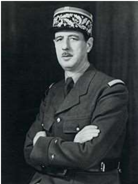
Général Charles de Gaulle 1890 – 1970 France Général d'armée pendant la guerre